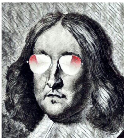
Pierre de Fermat

Das letzte Axiom ist in Wirklichkeit ein Axiomenschema , das für jedes \phi ein Axiom erzeugt, eine sogenannte Instanz . Diese Instanzen heißen erwartungsgemäß Induktionsaxiome . Die schematische Formulierung ist eine Annäherung an das eigentlich beabsichtigte Induktionsprinzip, das über eine Prädikatenvariable P anstelle von \phi redet, aber in Prädikatenlogik erster Stufe nicht ausdrückbar ist.